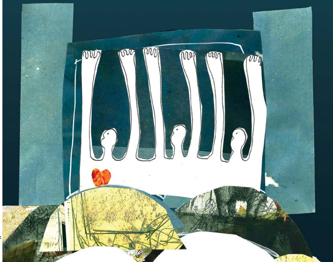
immagine Antonio Catalano